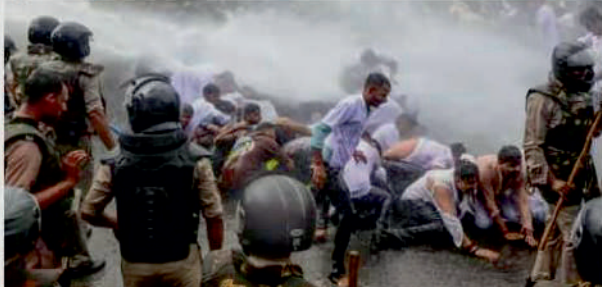
Police use water cannons to disperse National Students' Union of India (NSUI) activists during their demonstration against the alleged irregularities in NEET-UG exam 2024 and nursing college scam, in Bhopal.

Regarding the alleged incident of wrongful confinement from Nov 11 to 15, 2014, the court noting her contradictory statements, said she had admitted that she had accessed to Mahender's mobile phone at this time. Court acquits man in Delhi rape case due to lack of clear testimonies from alleged victim. Contradictions in statements led to acquittal. Get the details of the case here. Threatened by cops & accused, rape survivor, her father end lives in Rajasthan Tragic incident in Rajasthan as a 16-year-old rape survivor and her father die by suicide. Alleged threats from rapist's accomplices led to this extreme step. Police investigating the case and addressing lapses in the Bhopal case probe.